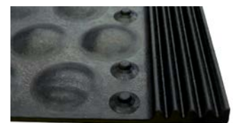
Robuste integrerede tætningslister forrest