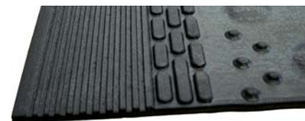
Med fald bagest og integrerede tætningsstriber