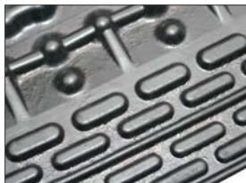
Tætningslister i den bageste del minimerer opsamlingen af snavs under matten