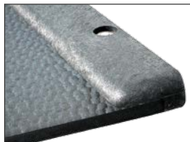
Afslutningsprofil – højre side