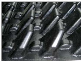
Underside med lameller og stødknopper: stabil og samtidig bevægelig

Den gennemtænkte underside-udformning tillader ingen udskæring i matten (f.eks. ved spærben osv.) ▶ kun egnet til frithængende sengebøjler